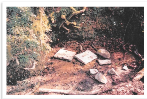
La fontaine il y a une trentaine d'années