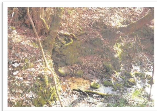
La fontaine aujourd'hui

Si vous désirez participer à l'élaboration de ce Petit Journal, n'hésitez pas à soumettre vos propositions d'articles à :